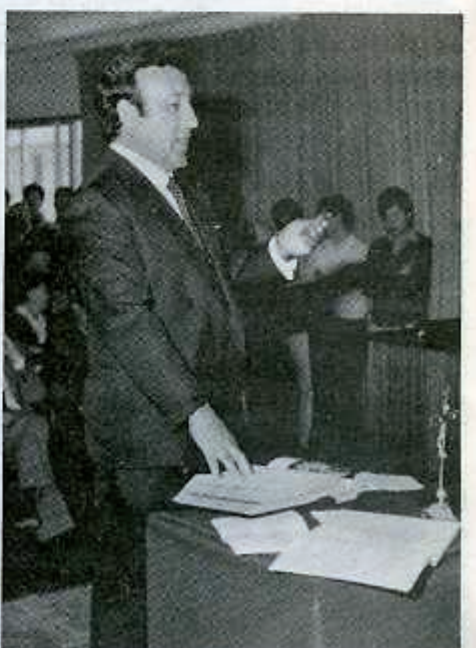
Sinfiorano Cantos Charcos.