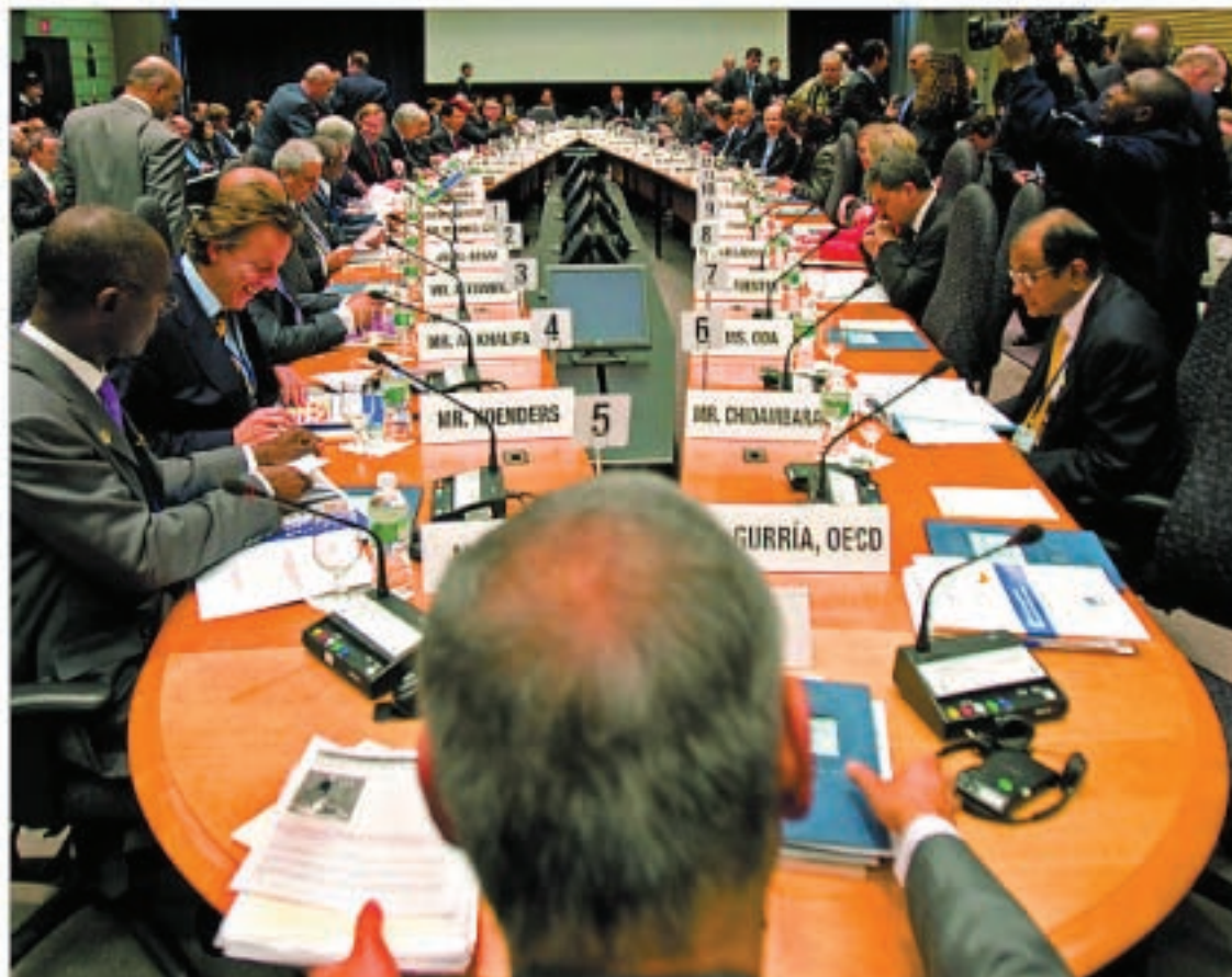
Representantes del FMI y del Banco Mundial al comienzo de la reunión de ayer en Washington.

El rechazo a los malos augurios del Fondo no es una excepción española. Las voces críticas han llegado también de otros países europeos, que acusan al FMI de aplicar a Europa una reducción automática en el crecimiento por los problemas de Estados Unidos. Solbes no negó que sobre España "planean riesgos derivados de las turbulencias financieras y la corrección del sector inmobiliario", pero aseguró que el sistema financie-