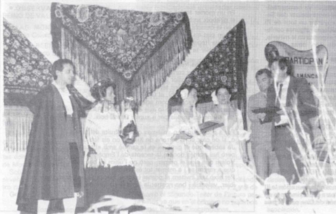
Momento de la entrega del recuerdo, como participantes en el V Festival de Bailes Populares "Valle del Azahar" en Coín (Málaga) el día 29 de diciembre de 1984.

En definitiva ha sido muy positiva la asistencia a dicho Festival Folklórico del que sin duda alguna permanecerá en recuerdo del Grupo de Ibi.