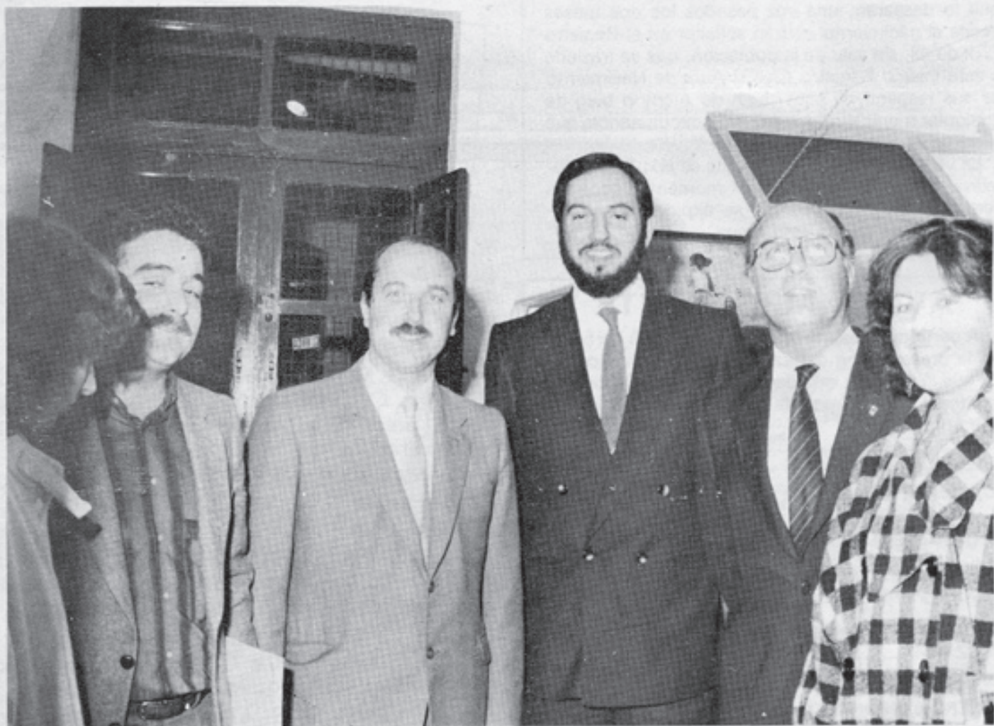
Inauguración del Centro de Planificación Familiar

Aulas de preescolar en el Colegio Público Plá y Beltrán