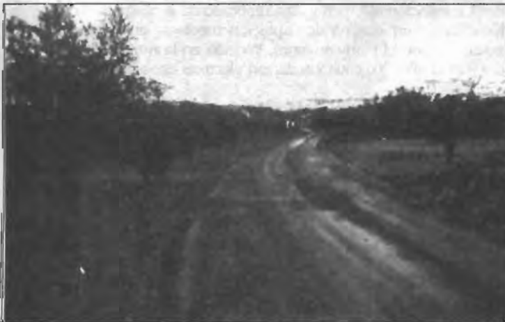
Camino de Devesa

Siguiendo la política de renovación y acondicionamiento de caminos rurales iniciada en el camino de Villalobos y Els Plans se han acometido las obras de asfaltado de los caminos de la Devesa. Las obras afectan a un total de cinco caminos, siendo la longitud de la actuación de 5.250 metros, con un ancho de camino de 4 metros.