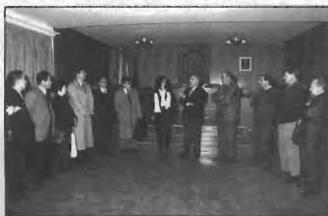
Visita misión china.