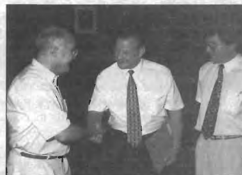
Visita delegación rusa.