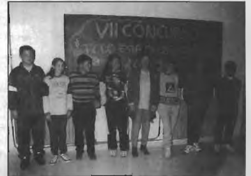
Ganadores del VII Concurso "Todo está en los libros" 1997.

Los alumnos concursaron de forma individual, localizando las respuestas de las preguntas de varios temas como: Historia, Geografía, Literatura, Música, Deportes, etc., utilizando para ello, una serie de obras de consulta y enciclopedias, efectuándose distintas fases eliminatorias consecutivas entre los clasificados, hasta conseguir un finalista en cada colegio, en arreglo al número de respuestas acertadas, así como el menor tiempo invertido en ello.