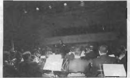
Concierto Santa Cecilia 97

Sábado, 22: Concierto del Grupo de saxofones "Rodolph Sax".