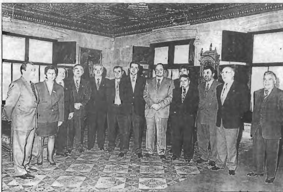
En la citada reunión, el Alcalde Zaplana, la conveniencia de visitar le le manifestó al Presidente oficialmente nuestra ciudad.

La OCDE han mostrado interés por colaborar y participar en el estudio previo como experiencia de colaboración interterritorial a modelizar.