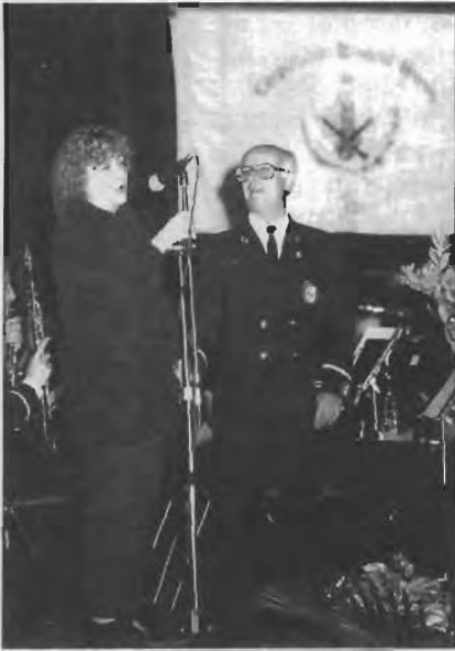
Concierto Santa Cecilia 97