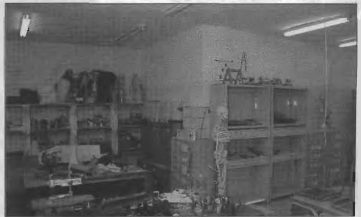
Aula de Pretecnología