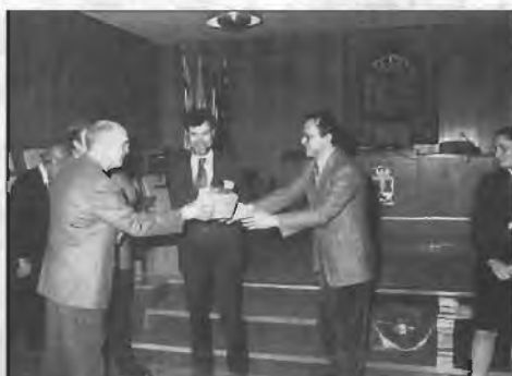
Visita misión italiana

Creemos que es una satisfacción el poder comprobar el interés suscitado por nuestro municipio y nuestra industria en un organismo, el más prestigioso a nivel mundial en organización económica y que, a su vez, regiones y países muy desarrollados se encuentran interesados en nuestras experiencias.