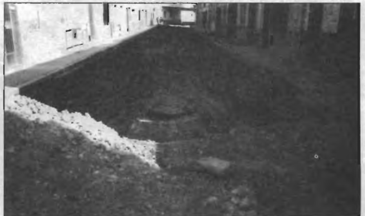
Obras en la calle Goya