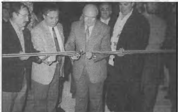
Inauguración pista de Frontenis

Terminada la partida de exhibición, fue servido un vino de honor en el Bar Restaurante del Polideportivo, para los asistentes al acto.