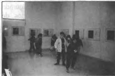
EN EL CENTRO CULTURAL DE LA VILLA