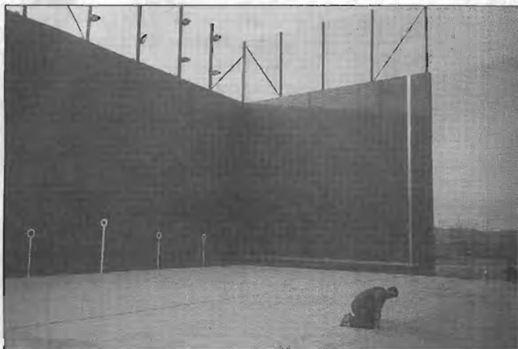
Obras nuevo Frontón