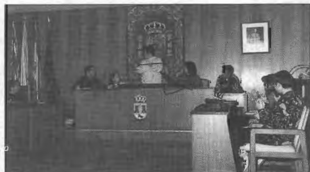
Pleno infantil sobre el racismo y la xenofobia

Representación de la Obra de Teatro "BAZAR" por la Compañía "PENTATION espectáculos" en el Centro Cultural de la Villa.