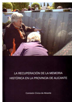
LA RECUPERACIÓN DE LA MEMORIA HISTÓRICA EN LA PROVINCIA DE ALICANTE

La Comisión Cívica de Alicante para la Recuperación de la Memoria Histórica , desde sus comienzos, ha estado formada por un grupo de personalidades y representantes de partidos, sindicatos y entidades cívicas, del cual surgían ideas y propuestas de actividades que eran discutidas, modificadas o matizadas por todos hasta llegar a un acuerdo. Siempre se ha trabajado por consenso, no tenemos presidencia ni cargos, y el portavoz de la Comisión puede ser cualquier miembro que se limita a comunicar lo acordado en las reuniones.