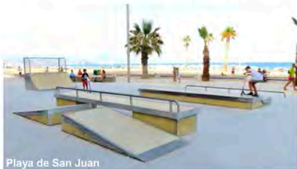
Playa de San Juan

Son cada vez más los jóvenes que practican deportes relacionados con el patinaje, tanto con patines, con patinetes, con monopatines o con bicicletas BMX. Desde hace años se viene demandando un espacio adecuado para la práctica de estas actividades deportivas y de ocio. En muchos municipios ya se han creado zonas de patinaje y pistas de skate, algunas más complejas técnicamente y otras de construcción más sencilla, pero todas gozan de gran popularidad. Estos son algunos ejemplos: