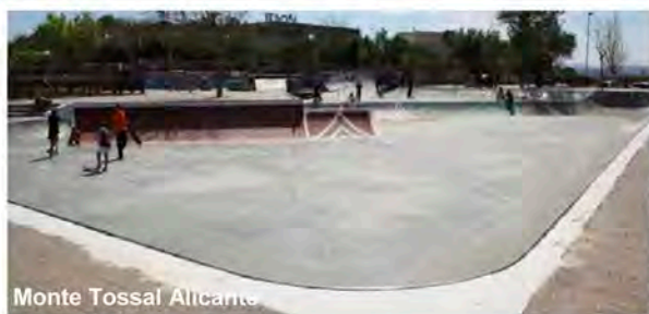
Monte Tossal Alicante