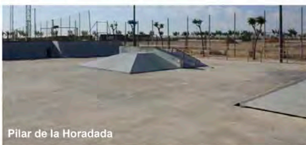
Pilar de la Horadada